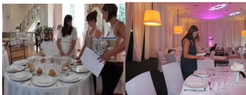
Les clés d'un plan de table réussi

Réalisation d'une organisation de réception d'une star de football avec un mariage à l'Américaine et d'une décoration de réception sur 3 jours par Christine Raiga, son équipe et ses élèves stagiaires Mobilisation de 16 personnes - 18 maîtres d'hôtels - 3 D.J et tous les autres prestataires.