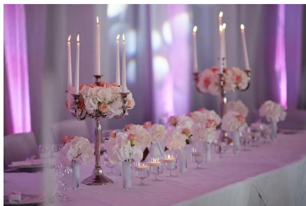
Notre réalisation du 11 juillet 2015