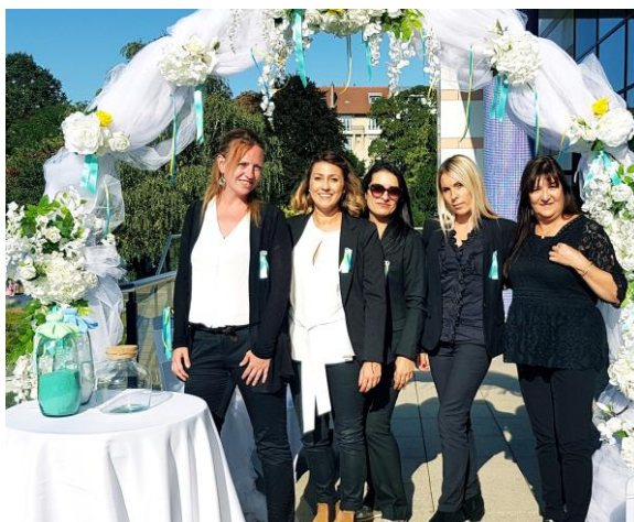
Réalisation de nos stagiaires le 11 juillet 2019 en vert Tiffany et Jaune