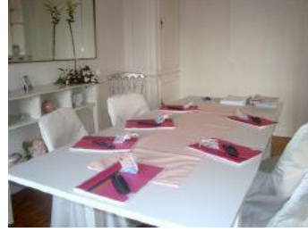
Votre centre de formation

Situé juste à côté des hôtels et du lac d'Enghien les bains – 10 minutes de Gare du Nord de Paris